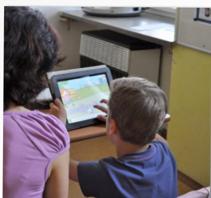
APPLE IPAD 2